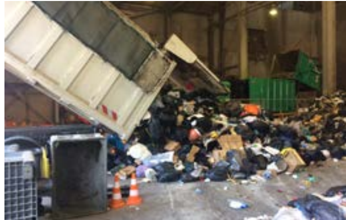
1 Le jour J, les camions arrivent à l'usine d'incinération de Passy et vident leur contenu au sol.

L'ÉCO a suivi les différentes étapes d'une caractérisation. Ouverture des sacs, prélèvements, mesures : découverte en images.