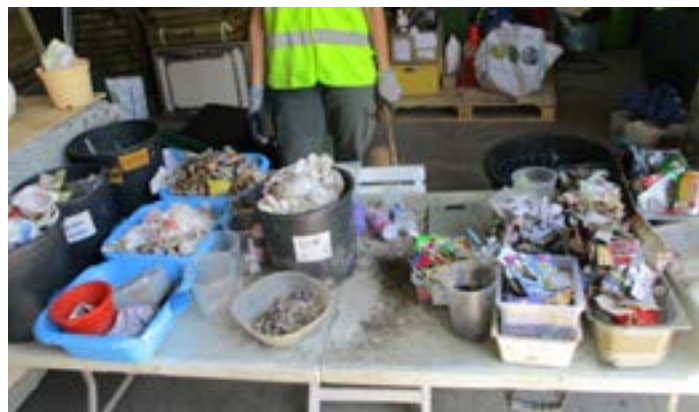
5 1/8 e de la quantité des déchets moyens (de 20 à 100 mm) est analysé.