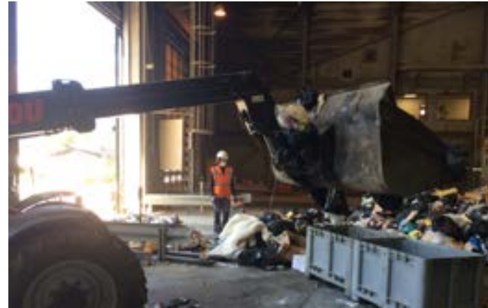
2 500 kg de déchets sont prélevés.