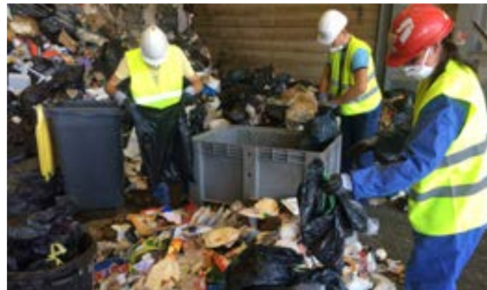
3 Les opérateurs de tri ouvrent les sacs et extraient les déchets atypiques qui fausseraient les données, ainsi que les déchets dangereux.