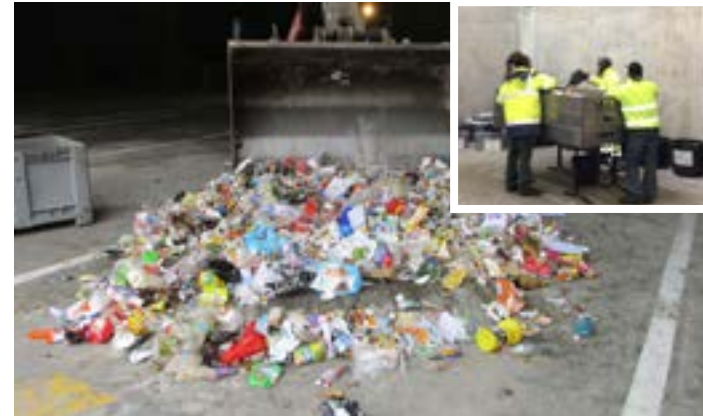
4 Un second prélèvement de 250kg est passé au crible afin d'être dissocié. Les gros déchets sont triés en intégralité.