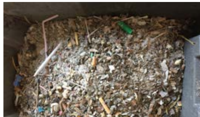
6 Les déchets fins (moins de 20 mm) sont pesés mais non triés.