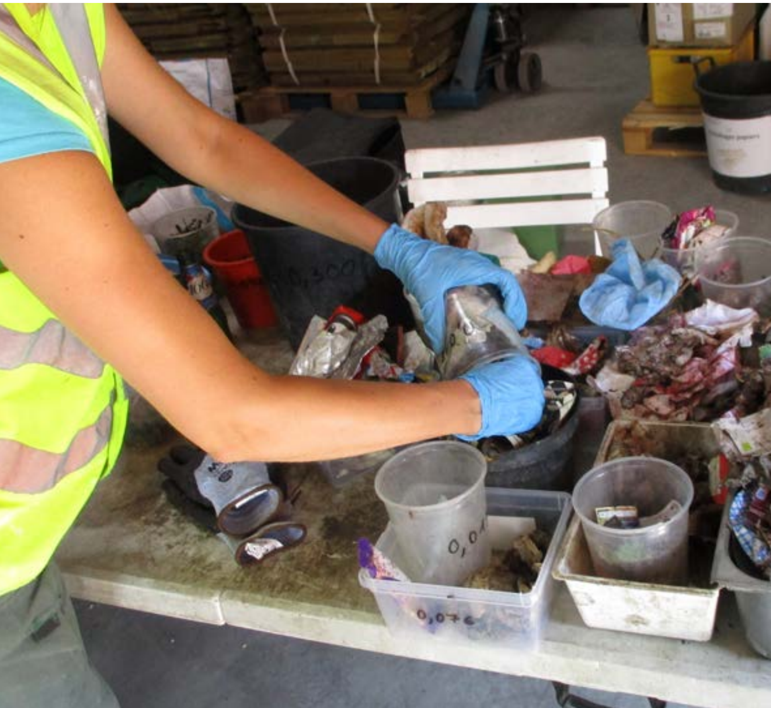
Le travail de caractérisation consiste à séparer manuellement les déchets pour connaître précisément le contenu de nos poubelles.

Depuis la loi Grenelle de 2009 sur l'environnement, les collectivités adhérentes au SITOM des Vallées du Mont-Blanc sont engagées dans une politique volontariste de réduction des déchets ménagers. La caractérisation est le point de départ de nombreuses actions.